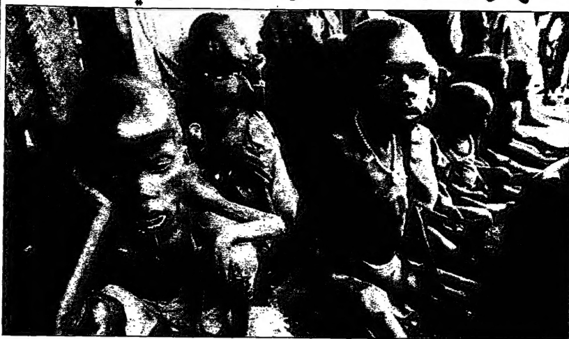
واشنطن - ناقش الرئيس الأمريكي

كبير الرئيس الأمريكي بيل كلينتون مؤلفا حكومة المناصب السودانية، وحل في المحرك الحرس ومحاكمة 2007 من قبله في قضية 1997 التي جرت في السودان في ظل الرئيس سني مبارك. وأكد في اجتماعه مع الكونغرس في واشنطن في أواخر الشهر الماضي أن السودان يشكل تهديدا لامن أمريكا القومي وسياستها.